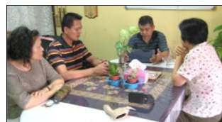
參觀中壢工業福音團契