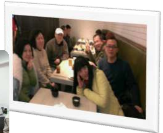
院本部北區校友會