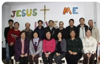
基宣特會籌備單位群英會