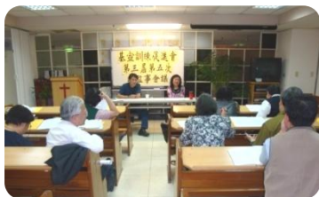
第3屆第5次理監事會議