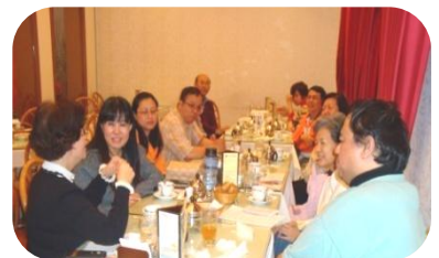
99-1汐止內湖區教輔會議